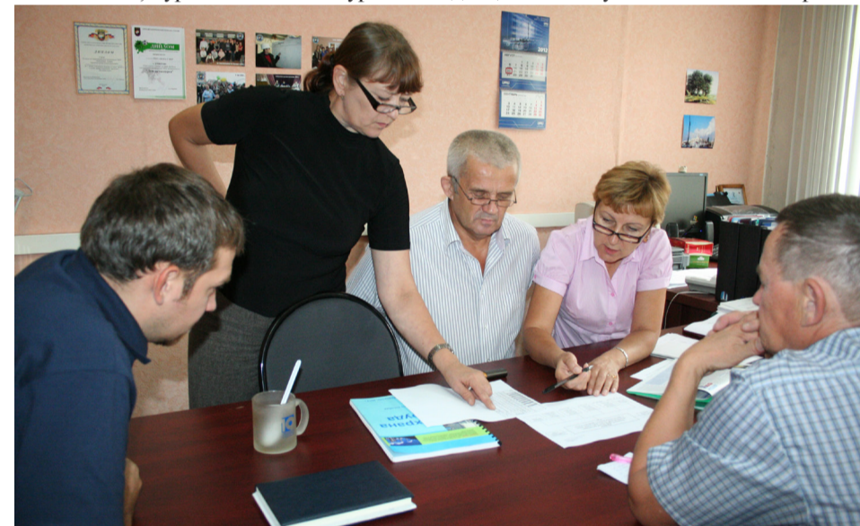
• Работа над колдоговором в профкоме Новокузнецкого вагоностроительного завода. 2013 год

Работа в областном комитете стала для меня новой ступенькой в профсоюзной деятельности. Организационный отдел, который мне довелось возглавлять с 2008 года, занимался планированием работы, подготовкой документов, проведением мероприятий, заседаний. Мне было поручено кураторство на некоторых предприятиях – «ЭлектроТехСервис», «Новокузнецкий вагоностроительный завод», «Запсибэнергоремонт», ОАО «Кокс», Гурьевский металлургиче-