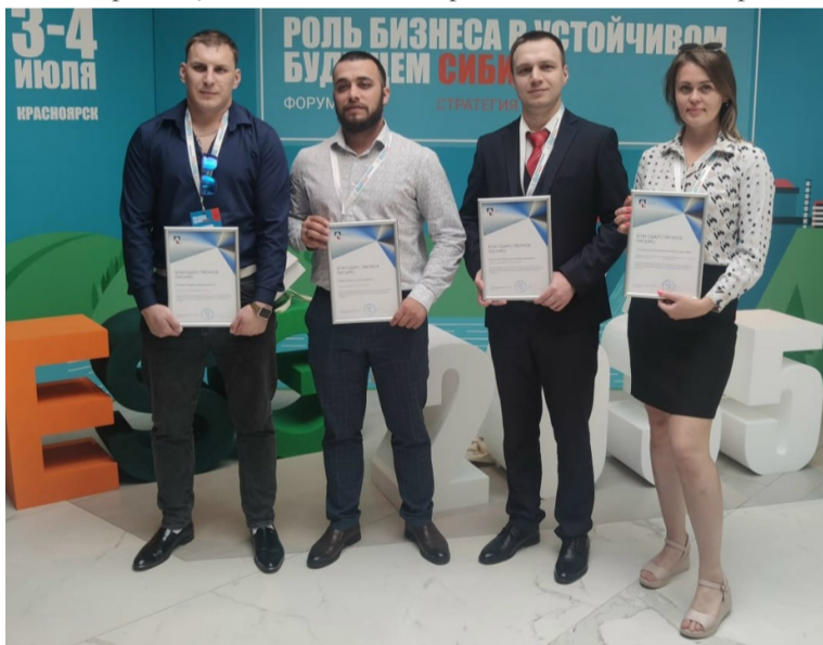
• С коллегами на форуме «Стратегия 2035»