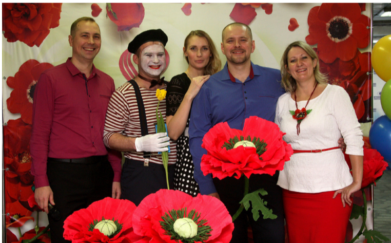
• 8 Марта на заводе. 2019 год