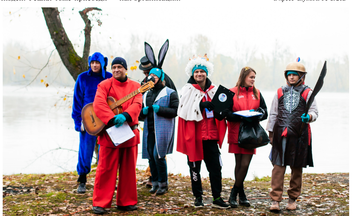
• День реки-2024: это и экологическая акция, и возможность раскрыть таланты

Кроме того, занимаемся шефской работой. Посещаем ребят из школы-интерната № 88, проводим с ними мастер-классы, игры, конкурсы. В прошлом году я решил принять участие в грантовом конкурсе РУСАЛа «Вдохновляй и действуй». Предложил проект, направленный помочь детям из подшефной школы-интер-