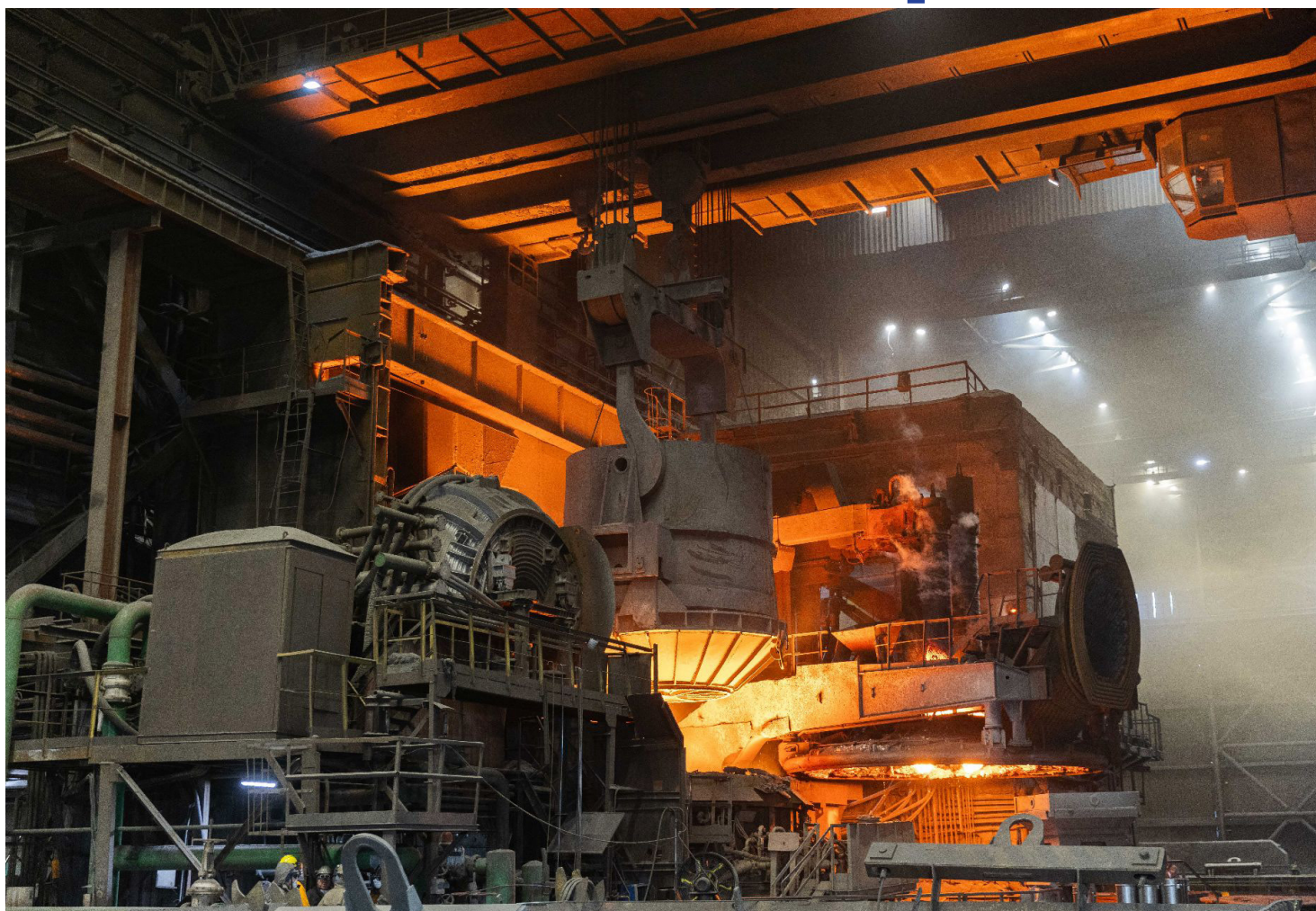
Электросталеплавильный цех ЗСМК.