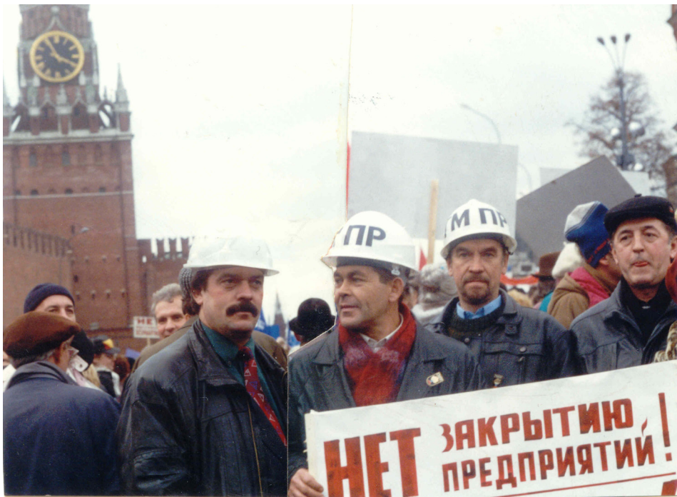
• Митинг, 1996 год.