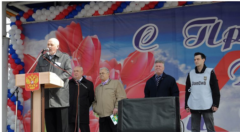
• Первомай, 2012 год