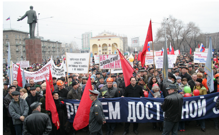
• Митинг на площади Маяковского, 2006 год