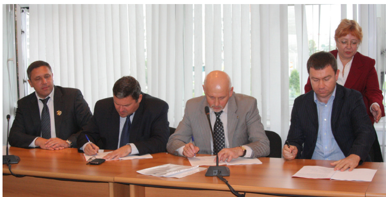
● Подписание Новокузнецкого городского трёхстороннего соглашения, 2004 год