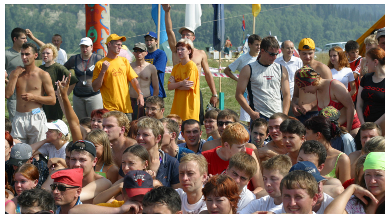
• Молодёжный фестиваль «Ювента», 2005 год