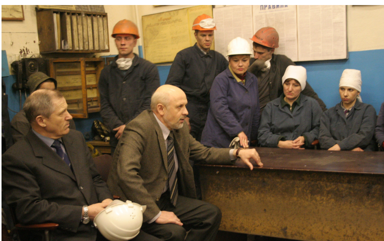
● День обкома в ППО «Кузнецкие ферросплавы», 2006 год