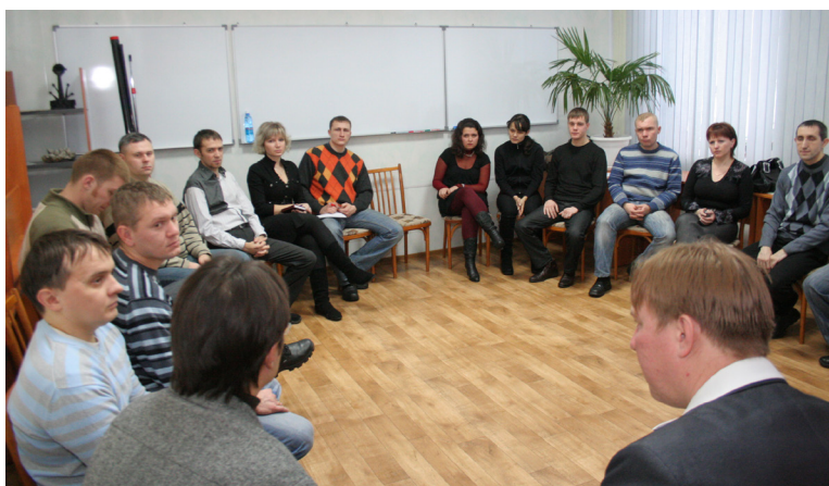
● Семинар для молодёжного профактива, 2010 год