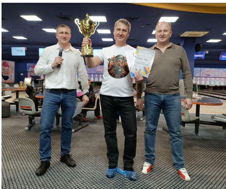
• Главный кубок — у «Кузнецких медведей» из электросталеплавильного цеха