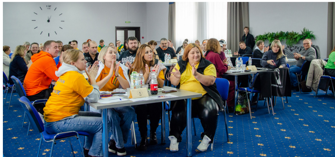
● Правильным ответам удивлялись и радовались всем залом!

Замкнули тройку лидеров, всего на один балл отстав от «Академии веселья», девушки из команды «Зелёный патруль». В этом году они провели «ре-брендинг» — сменили белые командные футболки на сочные