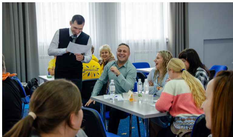
● «Феррики» поднимали настроение не только себе, но и другим командам

тили «Иван Васильевич», «Суворов», «Нил» и «12», то поздравляем, на квизе вас бы ждал успех!