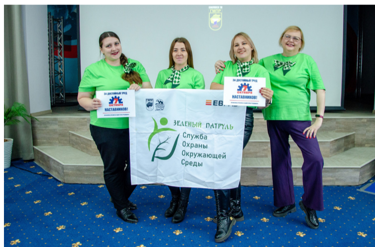
● Девушки из «Зелёного патруля» сменили имидж и взяли бронзу

В итоге весь пьедестал заняли представители ППО «ЗапСиб» ГМПР.