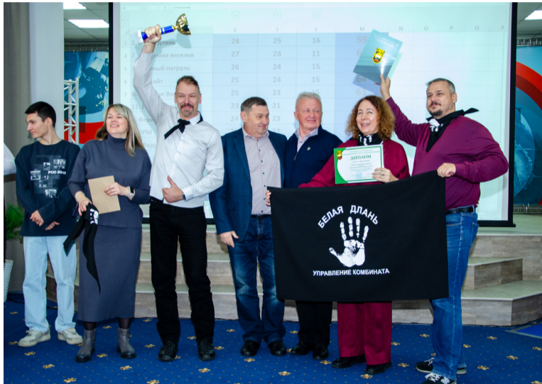
● Полный триумф команды «Белая длань»

Несколько часов команды разгадывали логические вопросы, в том числе на тему социально-трудовых отношений. Вспоминали факты из самых разных областей знаний: «Кто из героев советского фильма требовал продолжения банкета?», «Какой полководец совершает переход через Альпы на картине Василия Сурикова?», «На западном берегу какой реки находится Долина царей?» и «Сколько же всё-таки серий в легендарной киноэпопее про Штирлица?» Если вы уверенно отве-