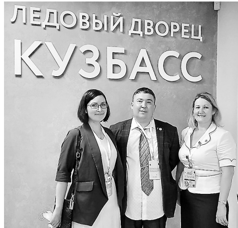
● Профсоюзный актив на юбилейном мероприятии

— У Кемеровской области — Кузбасса огромный потенциал развития как мощного промышленного комплекса и центра новой экономики Западной Сибири и всей России. И этот потенциал обязательно будет реализован, чтобы все, кто