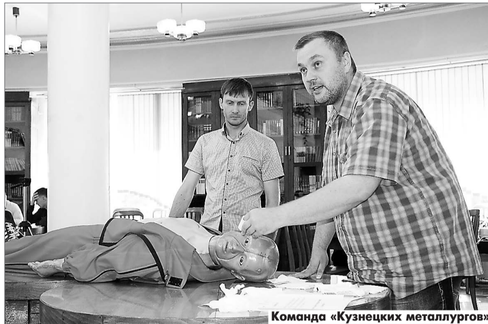
Команда «Кузнецких металлургов»