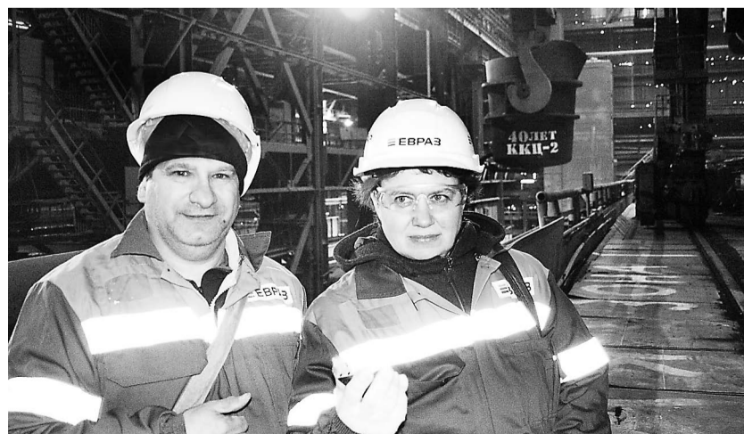
• Фотокорреспондент П. Иванцев и Л. Фёдорова на юбилейной плавке в ККЦ-2 ЕВРАЗ ЗСМК. 2014 год.