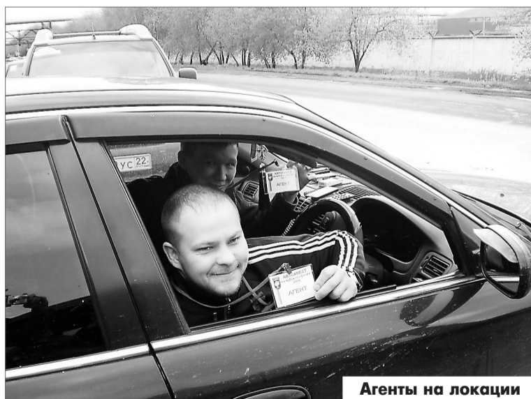
Агенты на локации