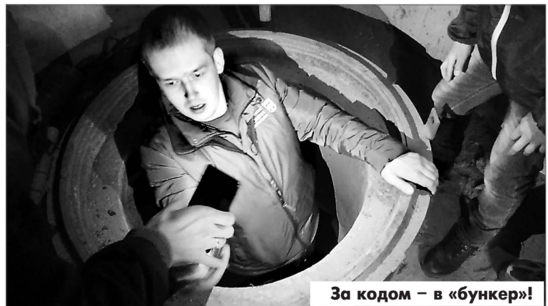
За кодом — в «бункер»!