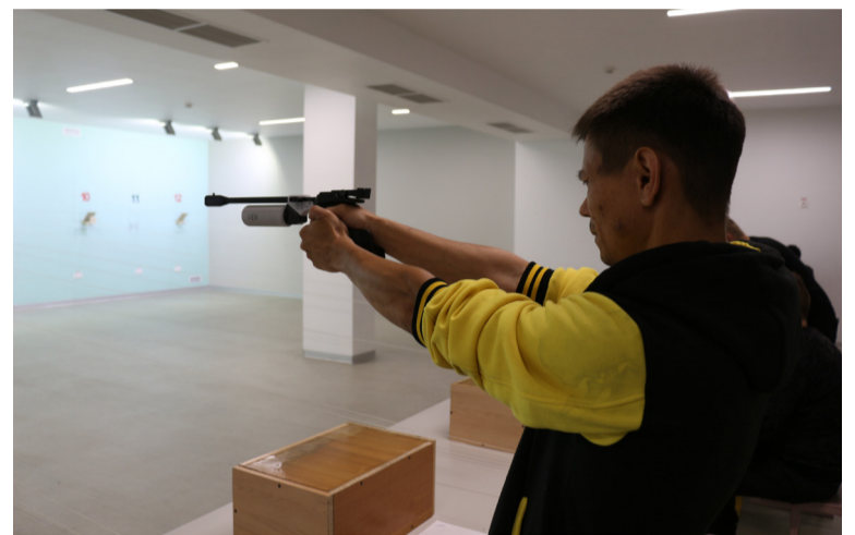
• Турнир по стрельбе. Июнь