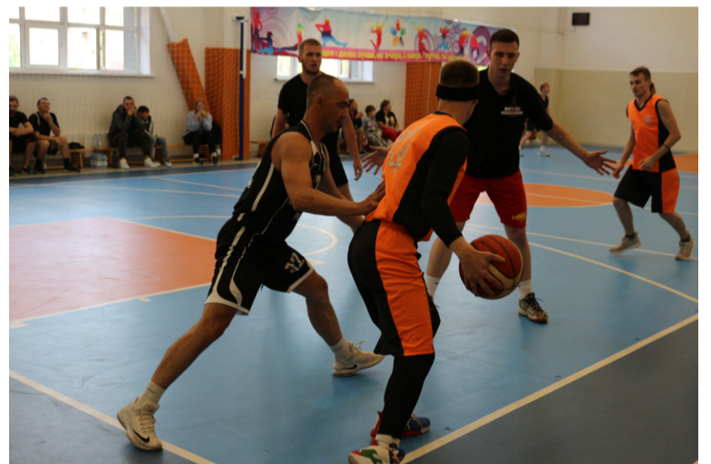
• Турнир по стритболу. Июнь