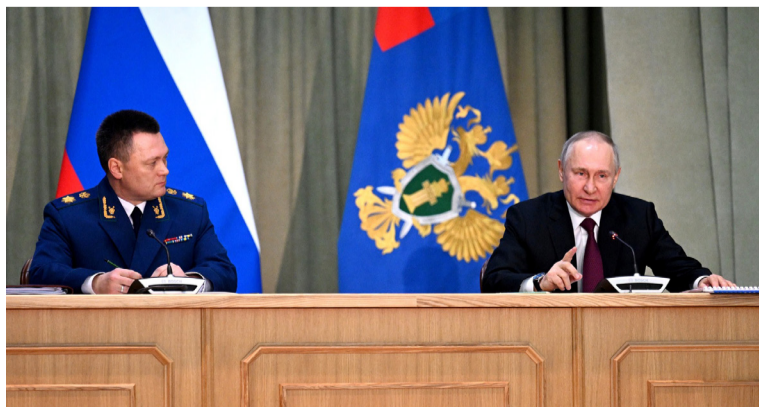
Фото и информация: сайт Кремля

щите прав несовершеннолетних, на этом остановлюсь отдельно. В ряде регионов были факты задержки положенных социальных выплат. Не везде должным образом решается и такая острая и чувствительная проблема, как обеспечение жильём детей-сирот. В том числе отмечены факты, когда детям-сиротам предоставлялись негодные для проживания квартиры. Прошу незамедлительно реагировать на подобные недопустимые ситуации. Да, ситуация непростая, связана с экономикой в каждом регионе, мы прекрасно это понимаем. Но есть вещи абсолютно недопустимые и, прямо скажем, вопиющие. На бюрократические издевательства над людьми и на прямое нарушение закона нужно быстро реагировать.