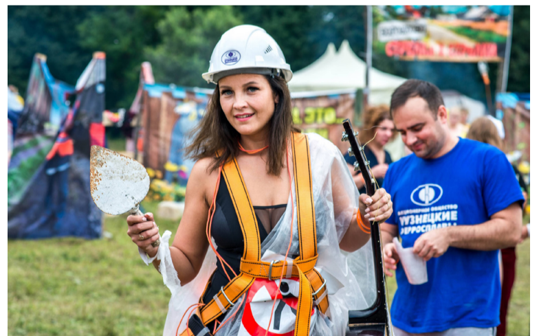
• «ПрофФест». Июль