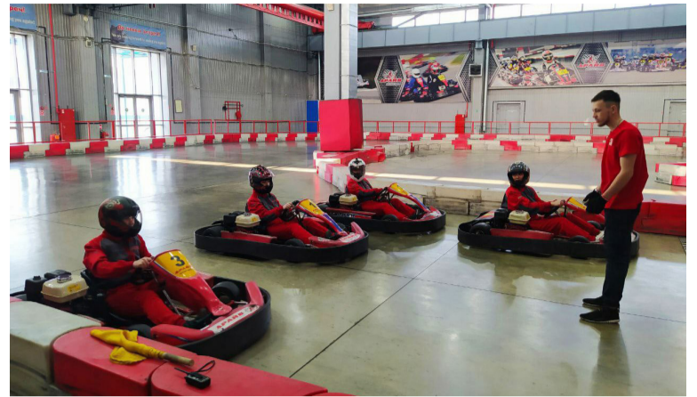
• Турнир по картингу. Апрель