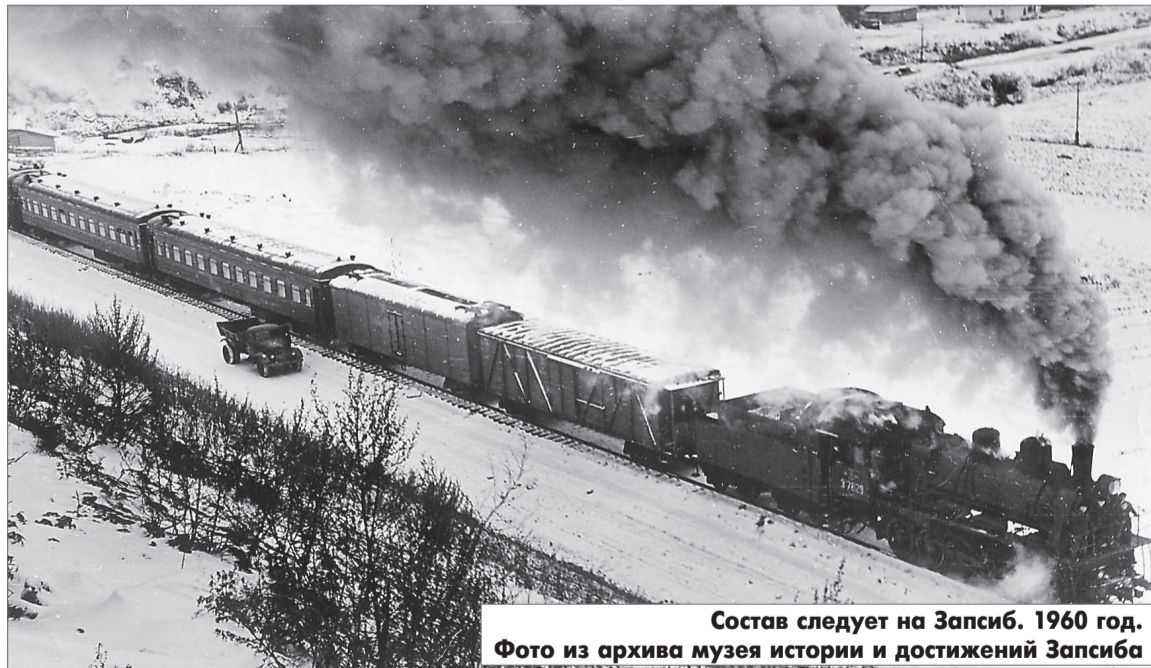
Состав следует на Запсиб. 1960 год.