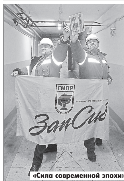
«Сила современной эпохи»

в стихах! Среди множества работ лучшую выбрать очень непросто, и споры жюри длились часами.