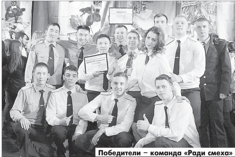
Победители – команда «Ради смеха»

Кузнецкого индустриального техникума «На своей волне», которая представила сразу несколько сценок – уморительных и даже саркастических. Ребята продрнули наших футболистов, которые после матча (конечно же, неудачного) с придыханием рассказывают, как пропустили мяч от «самых» (тут они называют имена футболистов команды-соперника) и мечтают после матча с ними сфотографироваться. А ещё они очень интересно и показательно представили сценку, где высмеяли нерыцарское по-