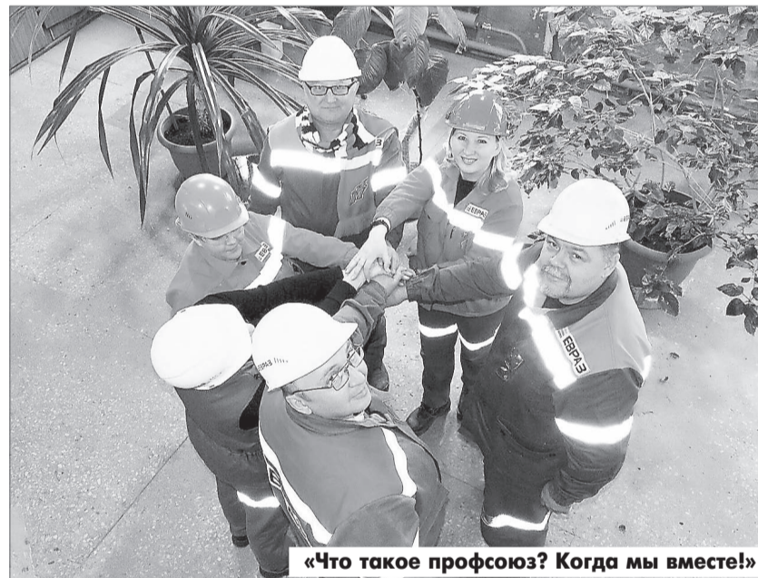
«Что такое профсоюз? Когда мы вместе!»