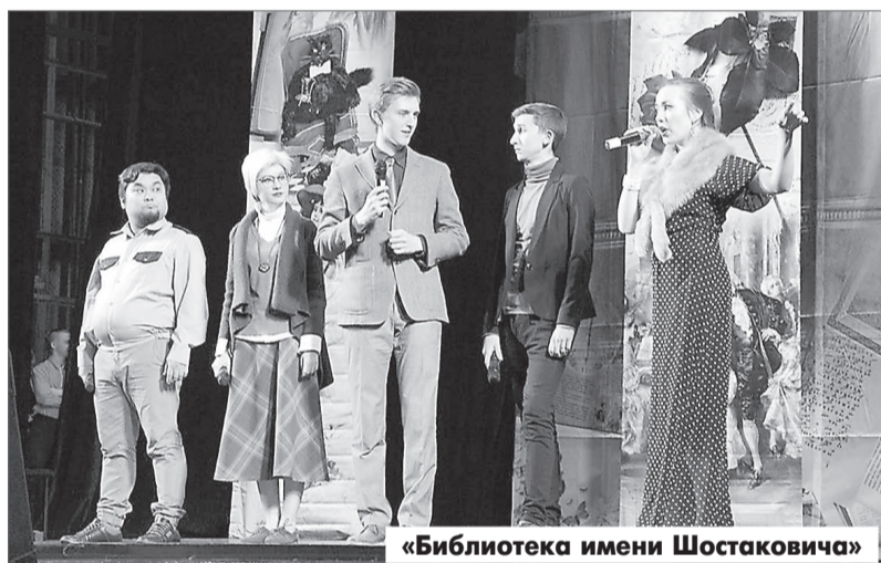
«Библиотека имени Шостаковича»