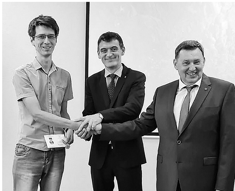
• На расширенном заседании профкома ППО «ЗапСиб» ГМПР. Июль 2022 года

Что касается заработной платы, стоит задача добиться максимальной компенсации роста индекса потребительских цен. В этом направлении и работаем.