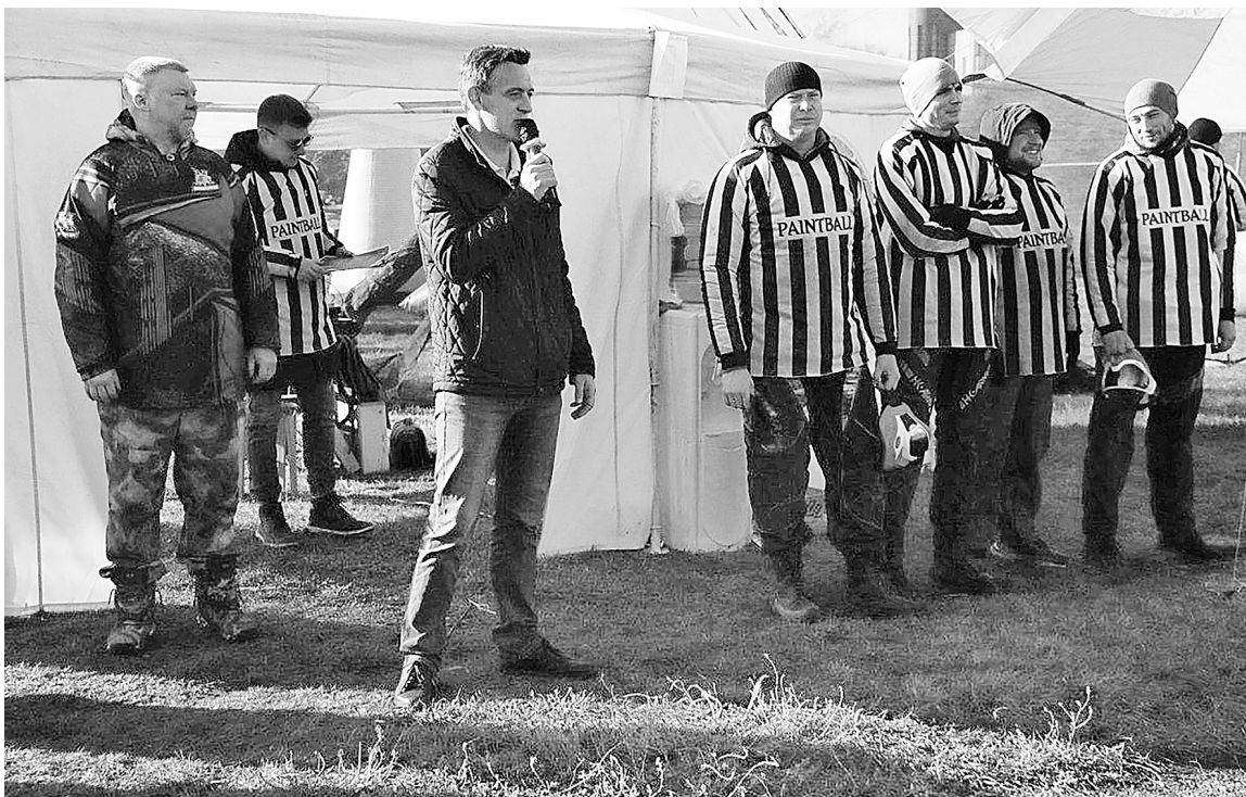
• Председатель ППО «ЗапСиб» ГМПР приветствует участников профсоюзного турнира по пейнтболу. Октябрь 2022 года

— Есть два основных мнения по этому вопросу. Одни уверены: если в Трудовом кодексе будет прописано, что условия колдоговора распространяются только на членов профсоюза, то все сразу вступят в профорганизацию. Я не сторонник такого подхода. Не верю в то, что в ту или иную общественную организацию сегодня можно привлекать