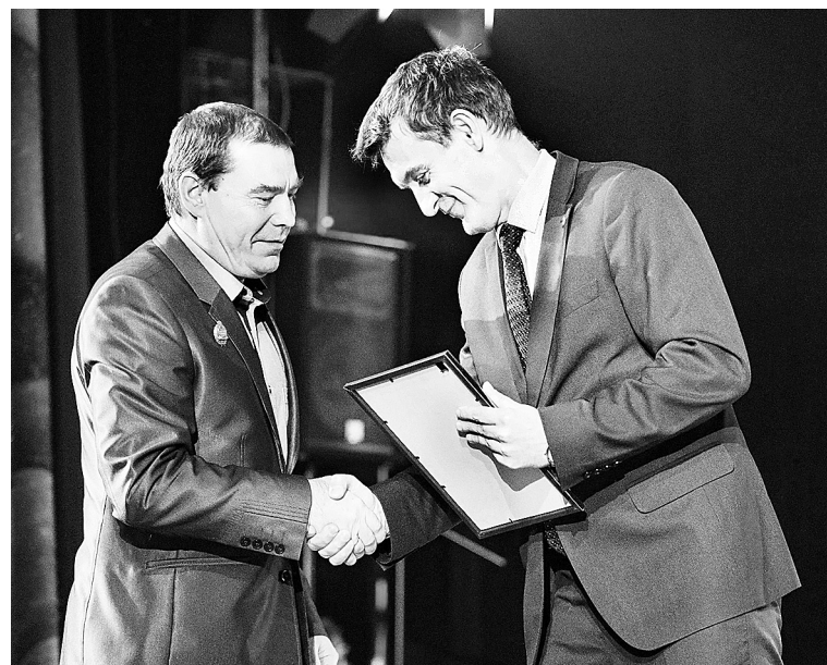
• Рельсбалочному цеху – 90 лет. Декабрь 2022 года

бильный спорт, и горные лыжи, и футбол, и прикладное творчество, и многое другое. И наша задача в том, чтобы оказать сильную поддержку тем, кто проявляет инициативу.