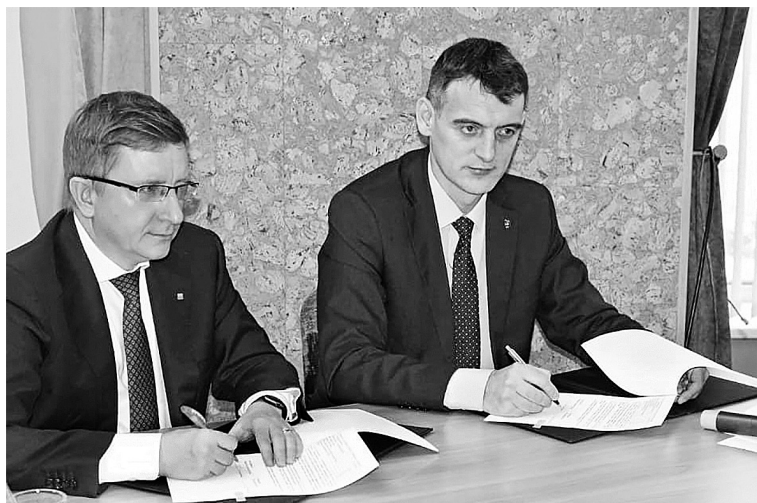
• Подписание соглашения с социальными партнёрами. Январь 2022 года

И это далеко не только информирование, но и учёт членов профсоюза, внутренняя ра-