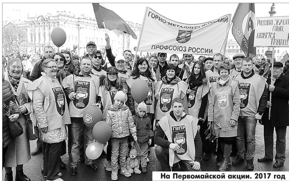
На Первомайской акции. 2017 год