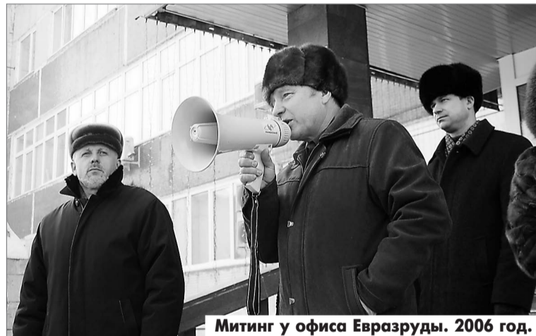
Митинг у офиса Евразруды. 2006 год.

Через месяц состоится Всероссийское совещание уполномоченных по охране труда. Соберутся порядка 100 человек. Наместилась тенденция роста несчастных случаев. В последнее время мы много внимания уделяли спецоценке условий труда, вопросы безопасности отошли на второй план. А условия работы горняков и металлургов нелёгкие: риски, вредные условия труда, подземная работа... Может быть, наших уполномоченных не слышат, может, им не хватает определённых знаний? Так что разговор предстоит серьёзный и важный.